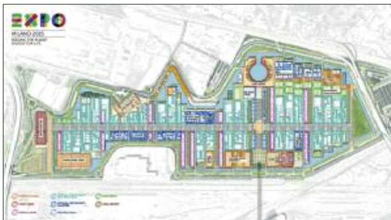
La "Piastra" di Expo 2015

Da qualche mese ICMQ è inoltre impegnato nel ruolo di coordinatore Leed per la fase di costruzione, per conto dell'impresa Torelli Dottori Spa , all'interno del processo di certificazione dell'intervento di ristrutturazione "Cascina Triulza", parte integrante dell'area Expo Milano 2015. La Cascina Triulza, tipica cascina della campagna milanese, sarà lo spazio all'interno del sito espositivo dedicato alle organizzazioni della società civile, che durante i sei mesi dell'Esposizione universale realizzeranno attività ed eventi negli spazi interni ed esterni; la Cascina verrà gestita, in collaborazione con Expo 2015, dalla Fondazione Triulza, costituita da un