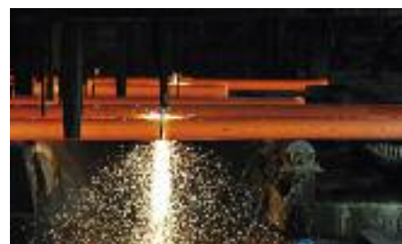
Fasi di lavorazione profili in acciaio.