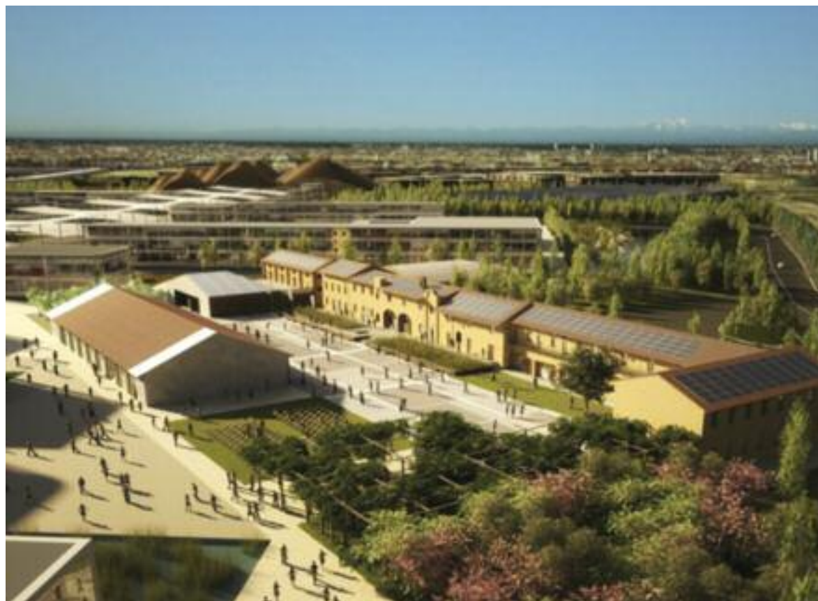
Il progetto di Cascina Triulza

“Cascina Triulza sarà lo spazio all'interno del sito espositivo dedicato alle organizzazioni della società civile”